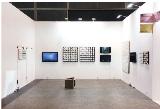
「Art Basel Hong Kong 2015」での高崎元尚作品《装置》の展示風景