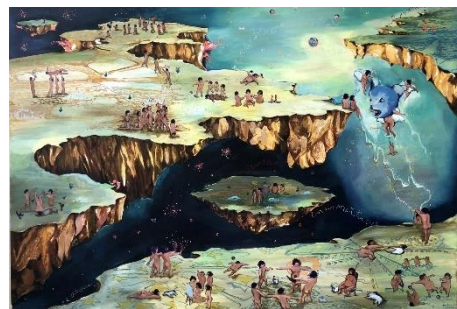
3. 田中麻記子 「たましいのじゅんぴ」 ©Makiko Tanaka