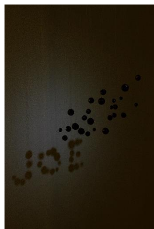
5. 川辺ナホ「The Black Cloud」